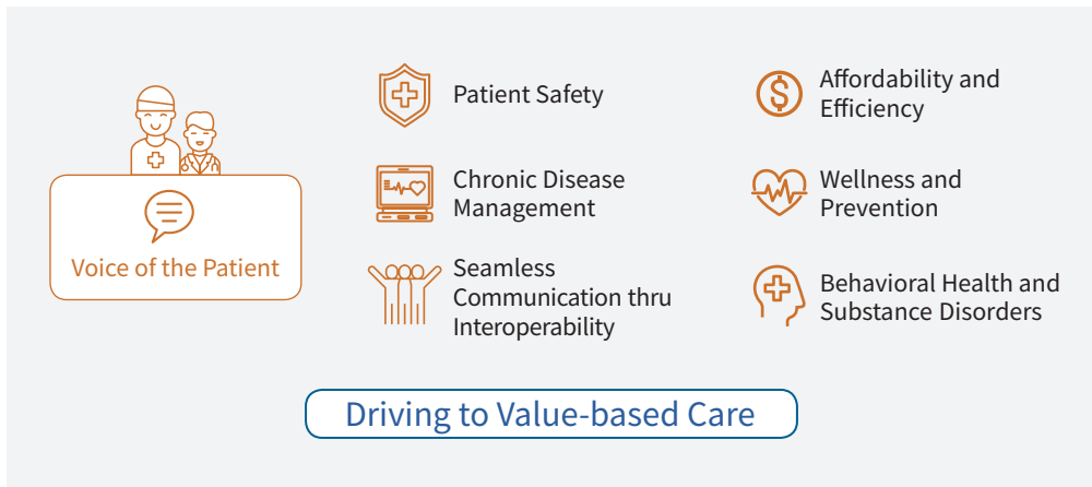
[그림 4] CMS의 Meaningful Measures Framework 2.0(draft)

CMS는 2020년 2월 개최한 컨퍼런스에서 ‘The Future of Quality Measurement: 2020 and Beyond’ 발표를 통해 CMS의 Quality Measurement가 앞으로 나아갈 방향에 대해 논하였다. 그리고 2017년 제안하였던 ‘Meaningful Measures Framework 1.0’에 이어 ‘Meaningful Measures Framework 2.0’의 초안을 제시하였다[그림 4]