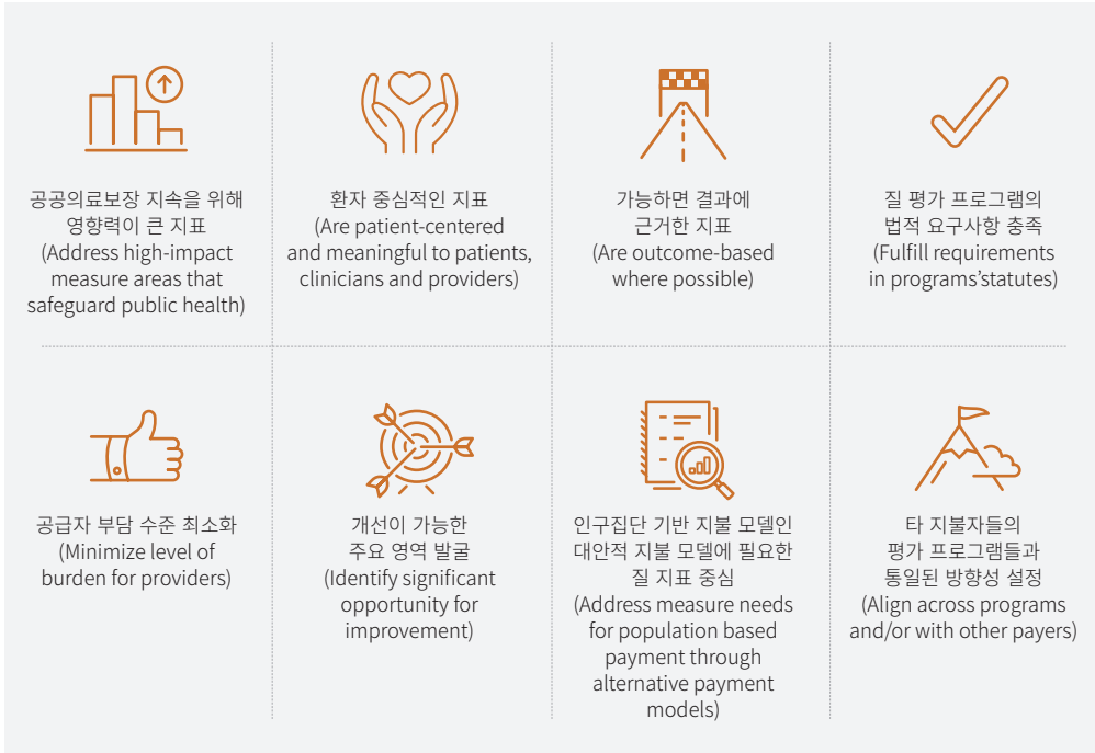
[그림 1] CMS의 Meaningful Measures Objectives