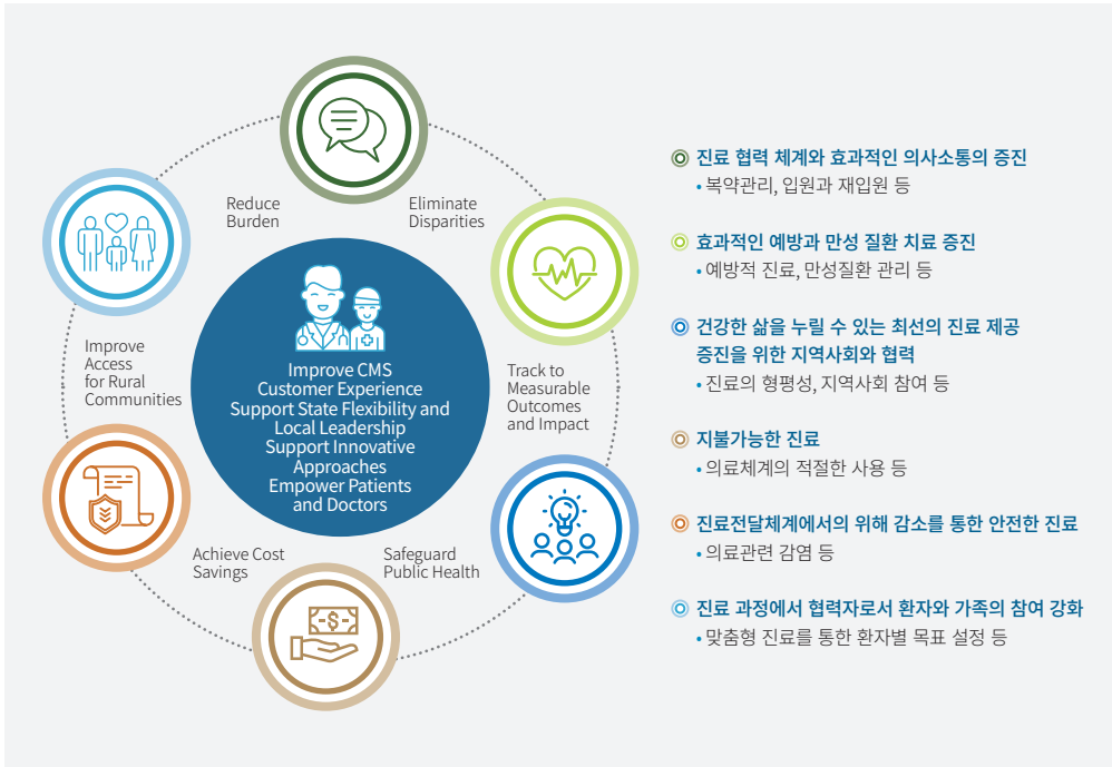
[그림 2] CMS의 Meaningful Measures Framework 1.0